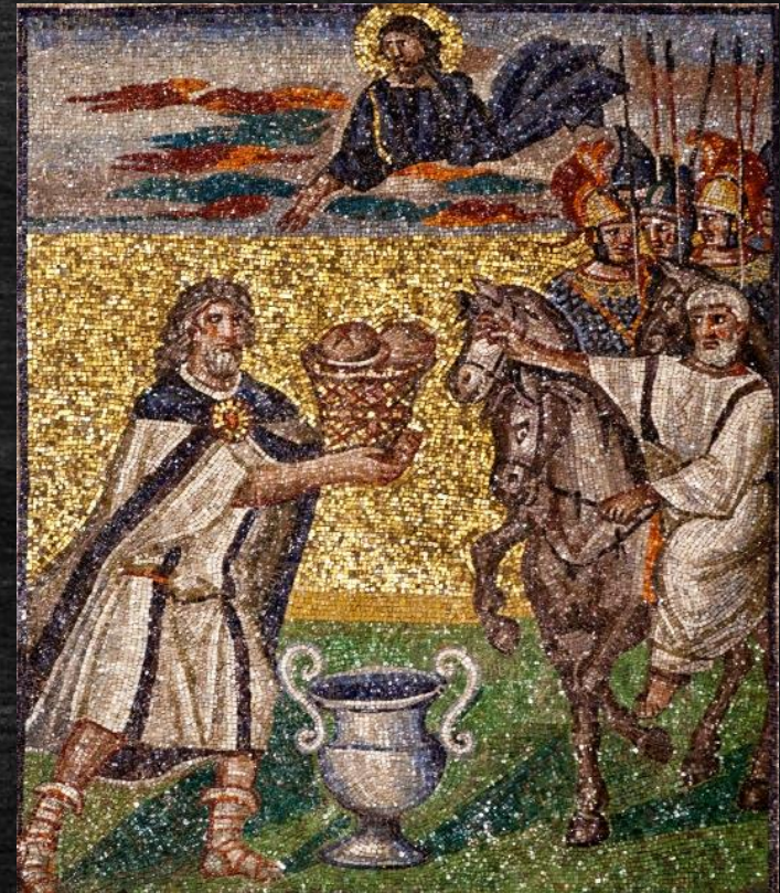
Abraham, Melkisédek et ... Jésus

Probablement écrite pour des chrétiens d'origines juives qui se posent des questions sur la réinterprétation du culte du sanctuaire et des sacrifices.